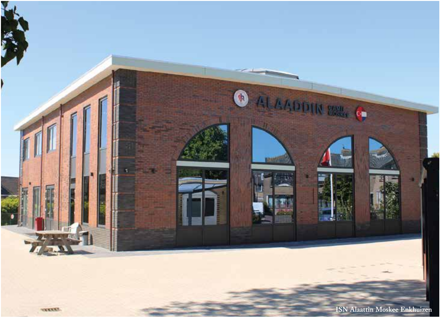
ISN Alaattin Moskee Enkhuizen