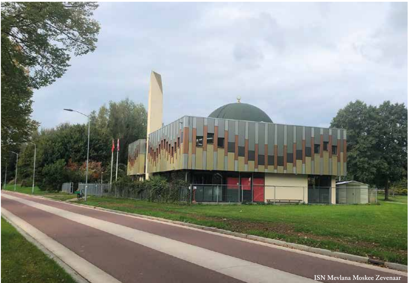
ISN Mevlana Moskee Zevenaar