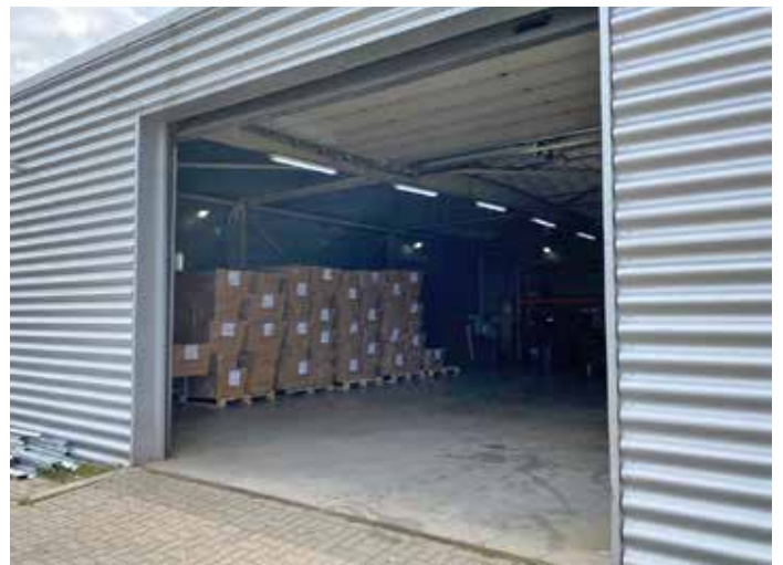
Vakif BV, Cateringweg 10, Schiphol