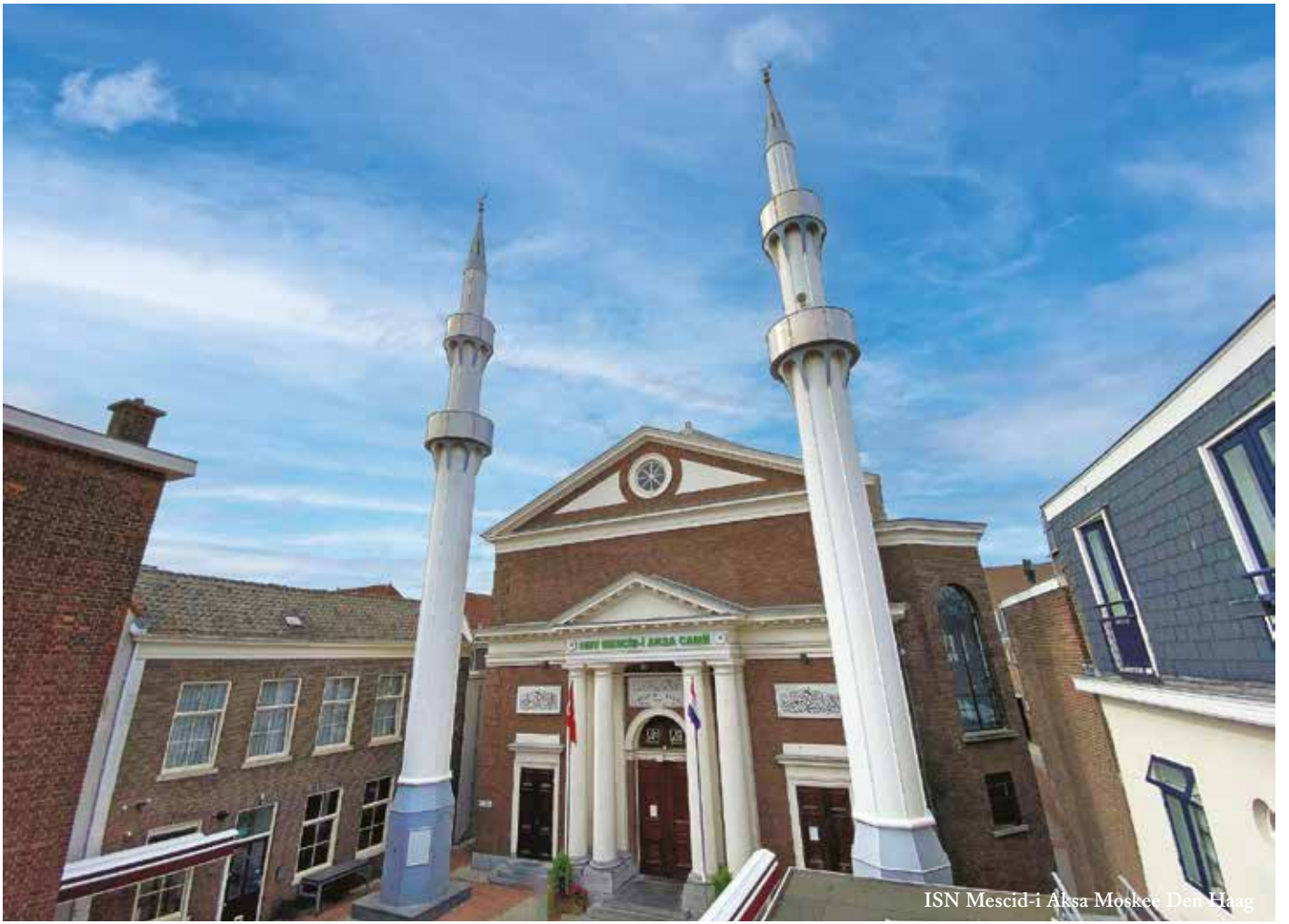
ISN Mescid-i Aksa Moskee Den Haag