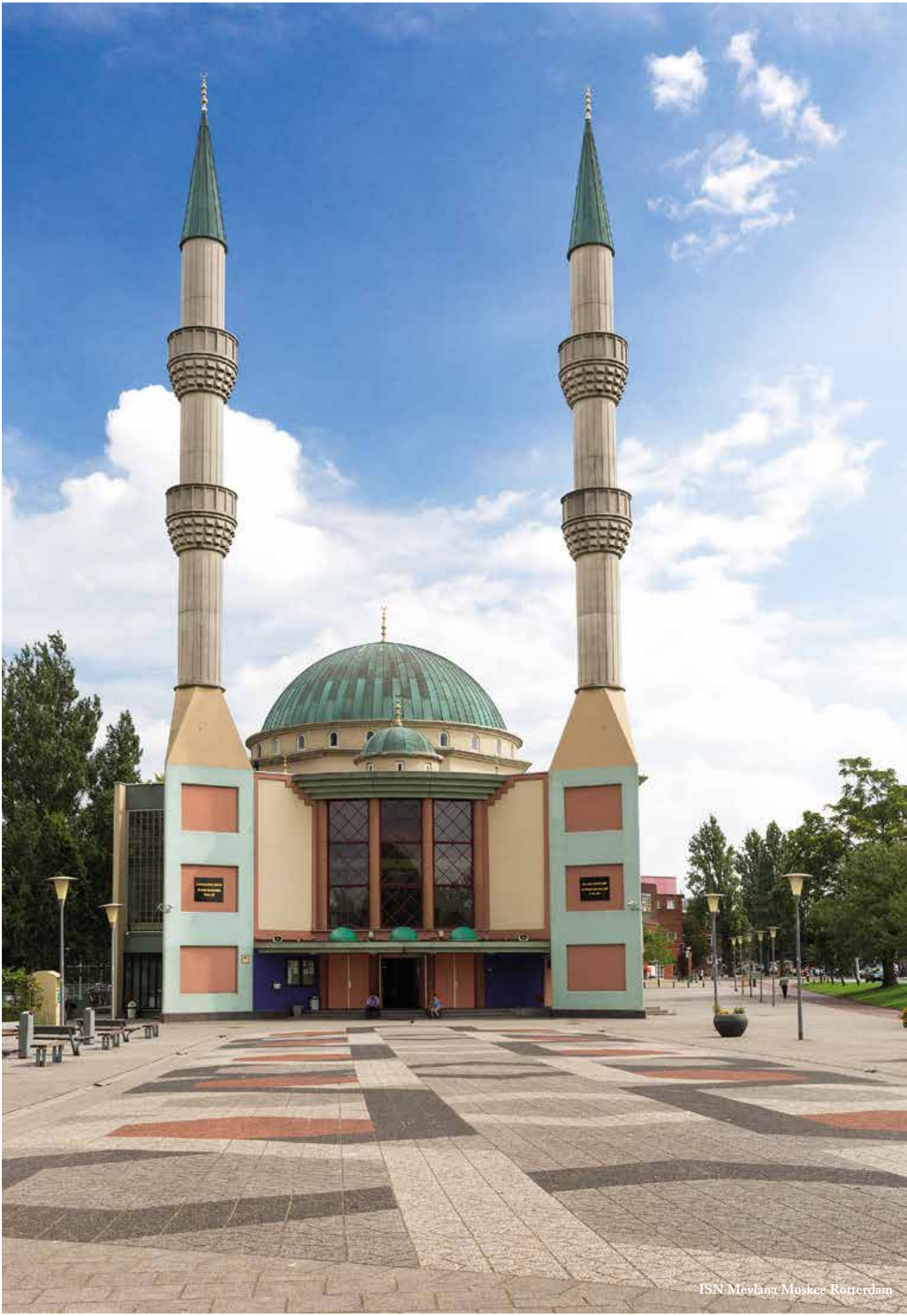
ISN Mevlana Moskee Rotterdam