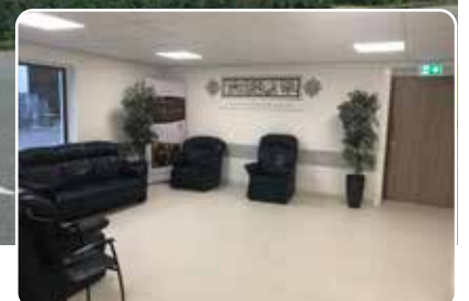
Vakif BV, Oder 13, Den Haag