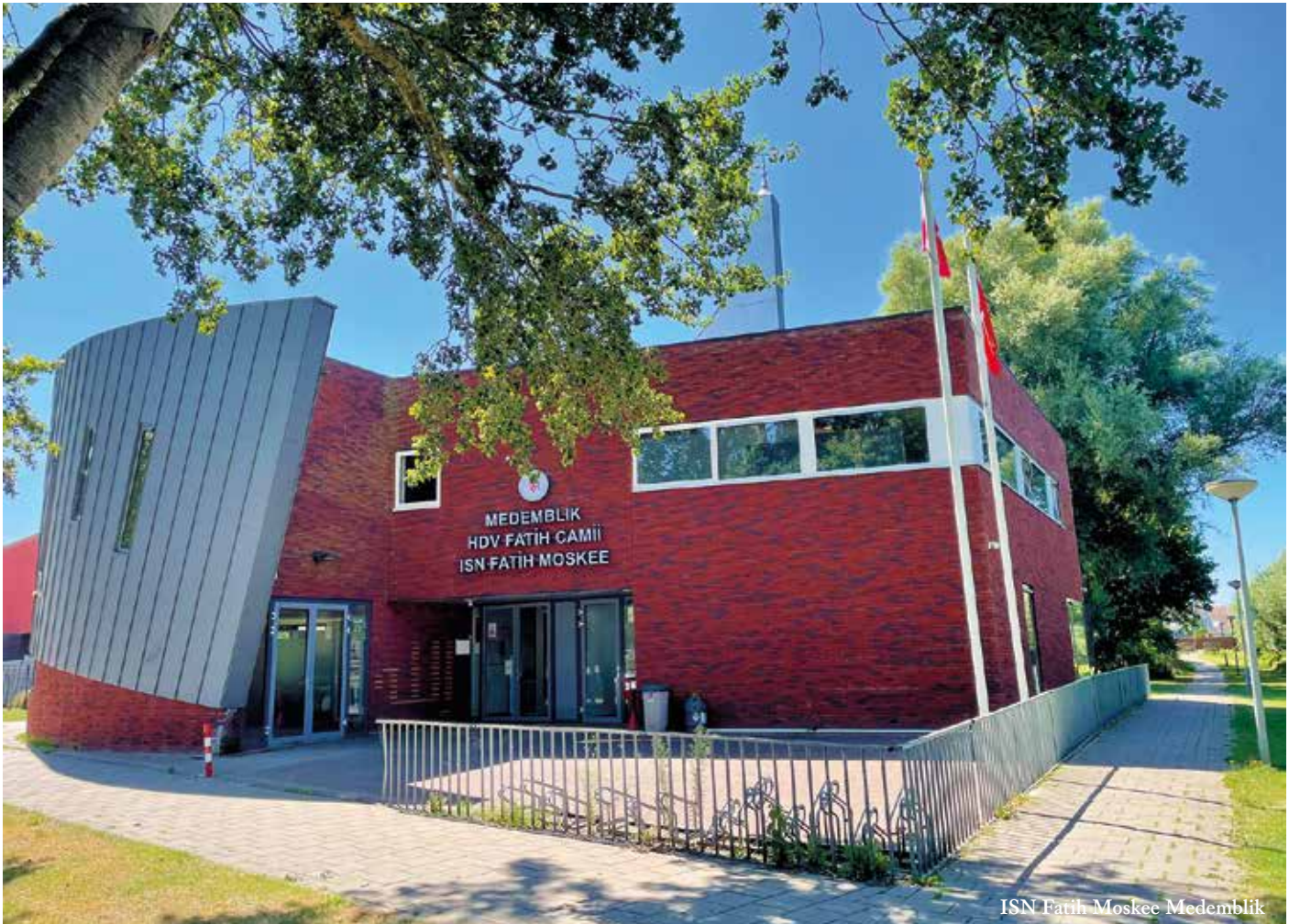
ISN Fatih Moskee Medemblik