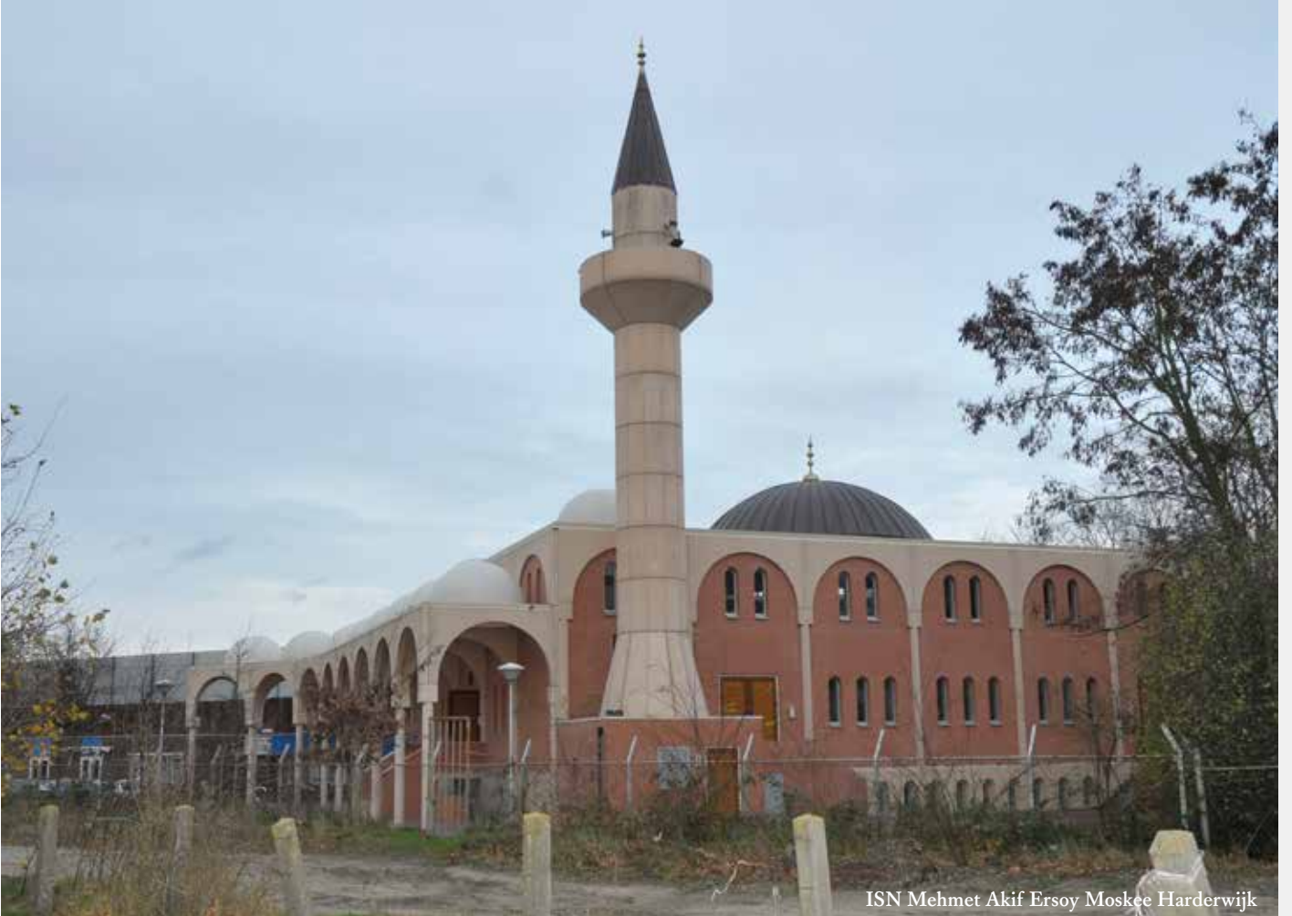
ISN Mehmet Akif Ersoy Moskee Harderwijk