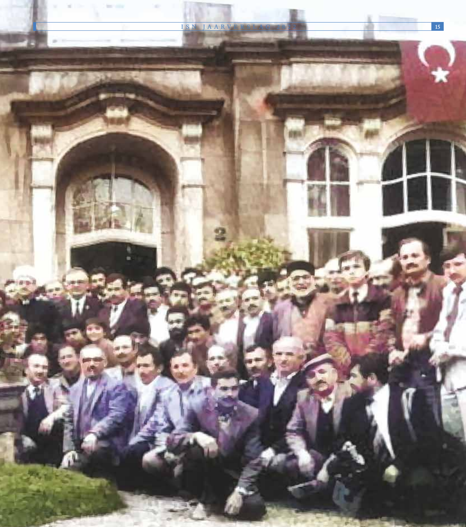
HDV merkez binasının 1984 yılında yapılan açılış töreni Openingsceremonie van het gebouw van de ISN in 1984