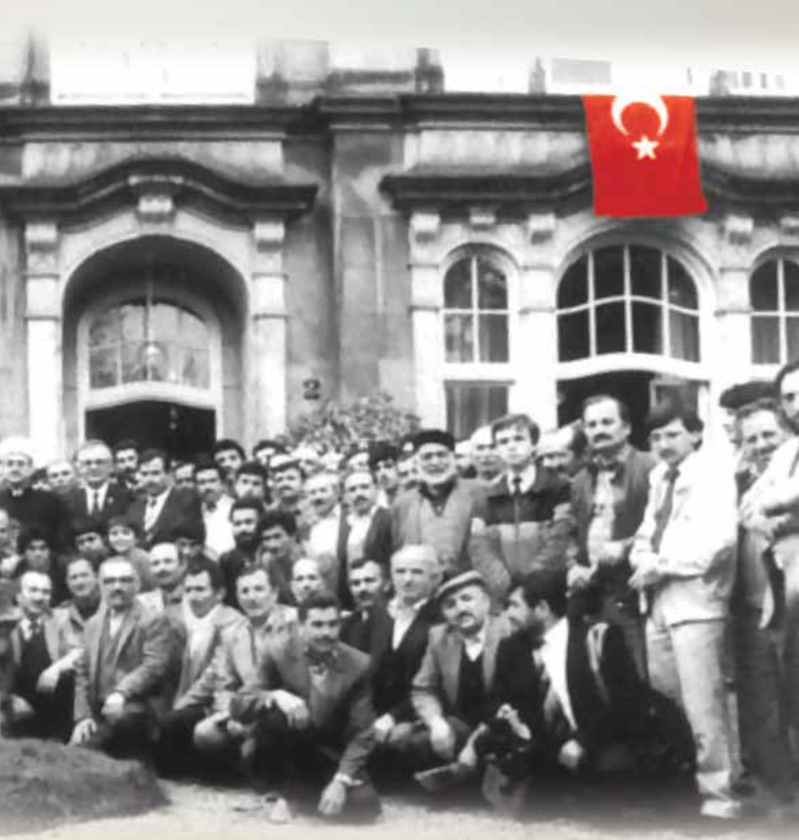
Açılış Töreni - 1984