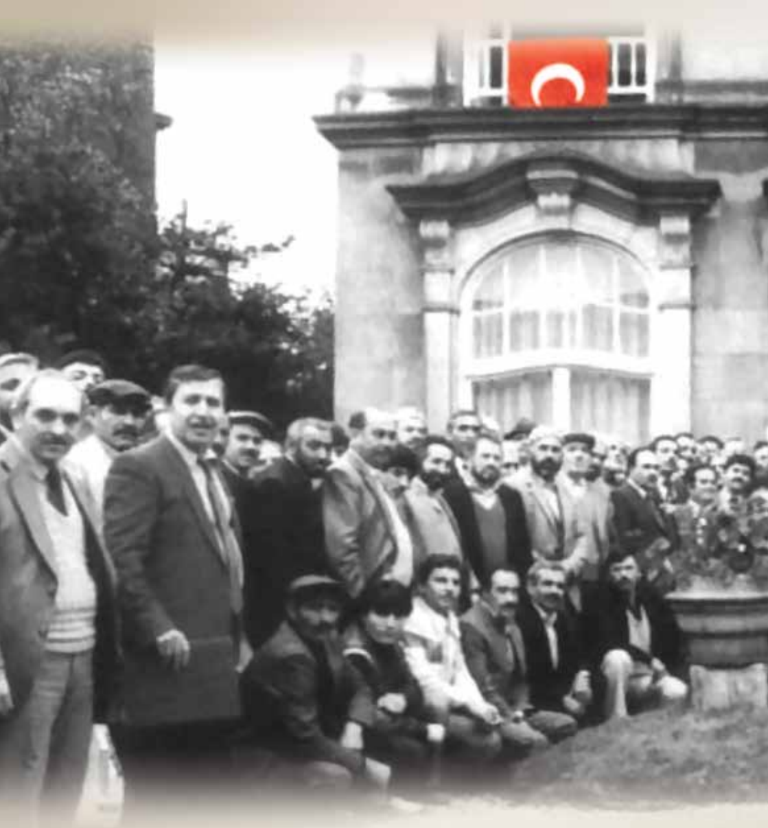
HDV Merkez Binası