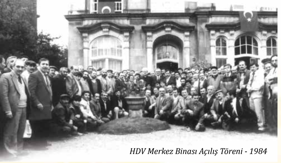
HDV Merkez Binası Açılış Töreni - 1984

Hollanda Diyanet Vakfı (HDV), Hollandaca ismiyle Islamitische Stichting Nederland (ISN), tarihi vakıf geleneğinin bir uzantısı olarak Hollanda'da yaşayan Türk vatandaşlarının ortak arzu ve gayretleriyle 10 Aralık 1982 yılında Rotterdam'da kuruldu. Villa, Hollanda'da yaşayan Türk vatandaşları tarafından 1984 yılında HDV'nin faaliyetlerinin sürdürülebilmesi için satın alındı. HDV, 1984 yılından günümüze kadar faaliyetlerini bu tarihi villada devam ettirmektedir. ( http://www.diyamet.nl/kurulus-ve-tarihce/ )